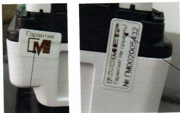
Схема пломбирования контрольными этикетками