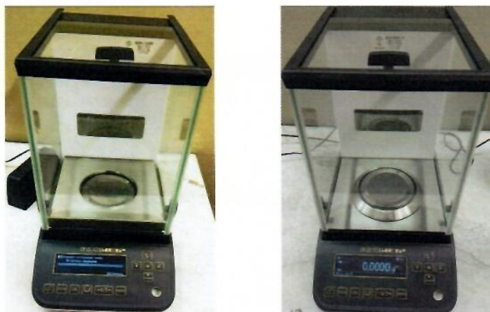
Рисунок 1 – Общий вид весов

По заказу весы поставляются с устройством ионизации воздуха для снятия статического электричества.