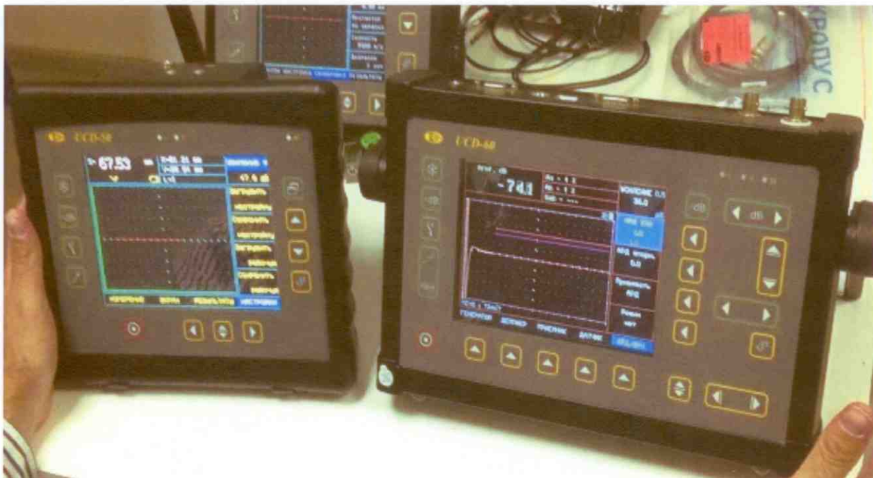
Рисунок 1 – Общий вид дефектоскопов УСД-46, УСД-50, УСД-60 для РУЗК

8.5 Общий вид дефектоскопов УСД-46, УСД-50, УСД-60 для РУЗК на этапе прохождения квалификационных испытаний в ООО «Газпром ВНИИГАЗ» представлен на рисунке 1.