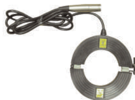
Клещи индукционные КИ-110